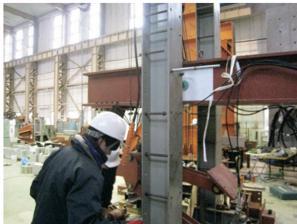
図 9.多目的載荷装置組換え