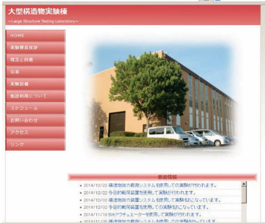
図 2.大型構造物実験棟トップページ