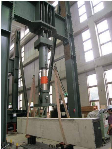
図 3.他大学での実験

建築専攻支援では、主にクライアント(研究室、学生)からの要望により実験・支援を行なっている。試験装置を使つての実験、講義実習の支援等幅広く支援を行なっている。実験・実習を行なうにあたり装置のメンテナンス・実験棟の安全衛生管理・クレーンの保守点検等幅広く支援を行なっている。また屋外でのロガー設置・データ回収・調査、図 3 のように他大学での実験支援も行なっている。