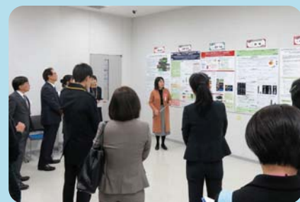
2016年12月3日 合同研究発表会の様子