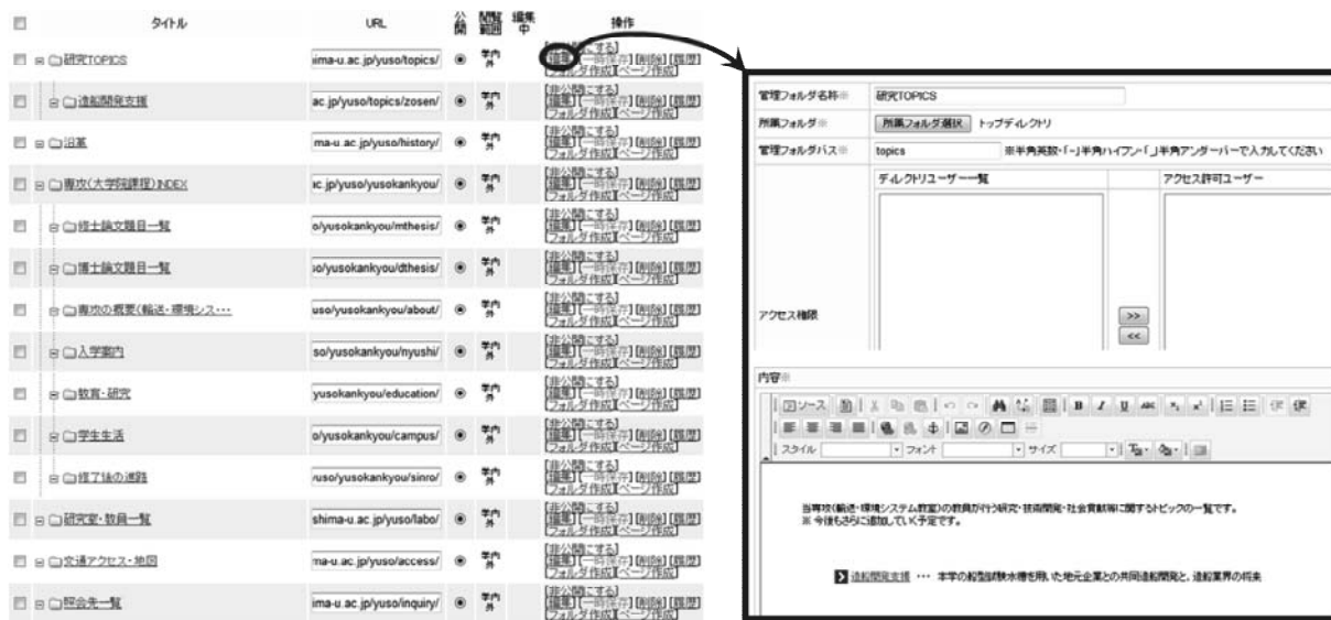
図 2. フォルダ構成およびエディタ操作

の各メニューブロックについては、コンテンツの充実化を図るために、(他専攻の各 Web サイトと共通で)当初準備されたメニューに対して、新しいメニューの追加や既存メニューの改良を行った。