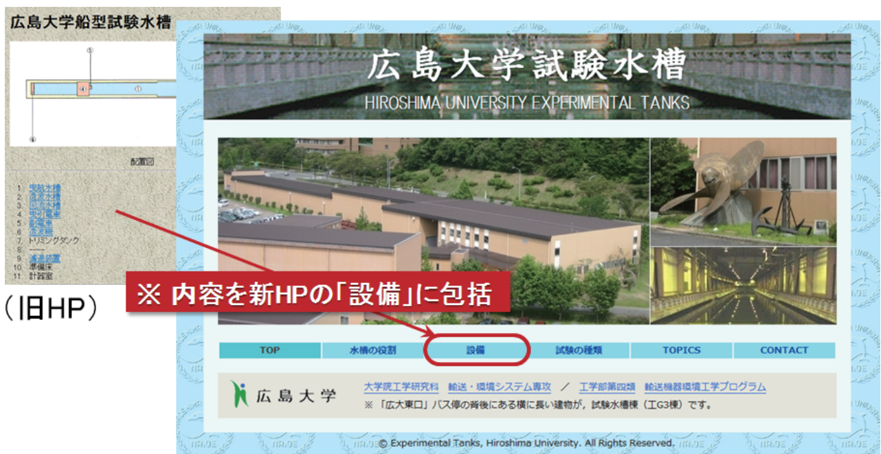
図 5. 広島大学試験水槽トップページの新旧比較