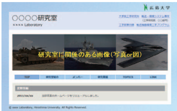
図 4. 研究室トップページのサンプル