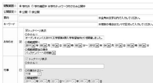
図 3. お知らせ・行事各記事に対する設定

また、この広島大学ウェブマネジメントシステムではシステム内の Web サイト間において、お知らせ・行事各記事の連動掲載が可能である。例えば、自サイトで作成した記事を研究科本体や大学(法人本部)のトップページからも直接参照できるようにしたい場合、当該記事に対してシステム上で連動掲載登録をすることにより依頼し、その管理者に承認(許可)されれば記事へのリンクが追加される。同様に、システム内における他サイトの管理者から自サイトに対して、トップページへの記事の連動掲載登録依頼があった場合には、システム上でその承認操作を行うことによってその記事のリンクを追加することができる。ちなみに、