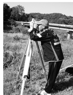
図3. 河川の現地観測

工学実験実習班は現在6名で、主に電気・電子系、土木系、建築系で業務を行っている。業務内容は実験・実習の支援、実験機器の操作および保守管理、研究・教育環境の整備等である。