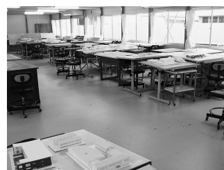
図6. 建築設計製図室