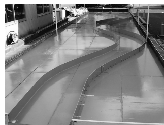
図4. 蛇行水路氾濫実験