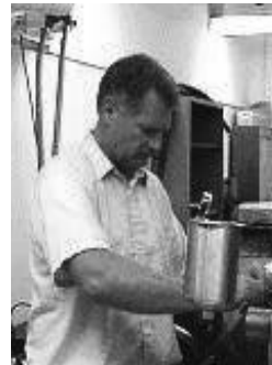
ガラス職人(週に1回:年給60,000ドルの五分之一)