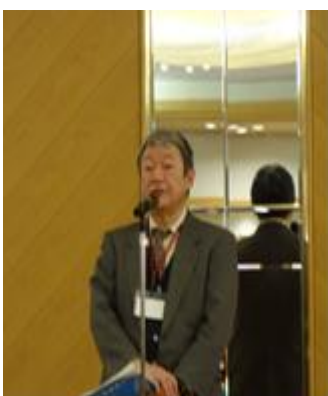
(飛田校友会事務局長)