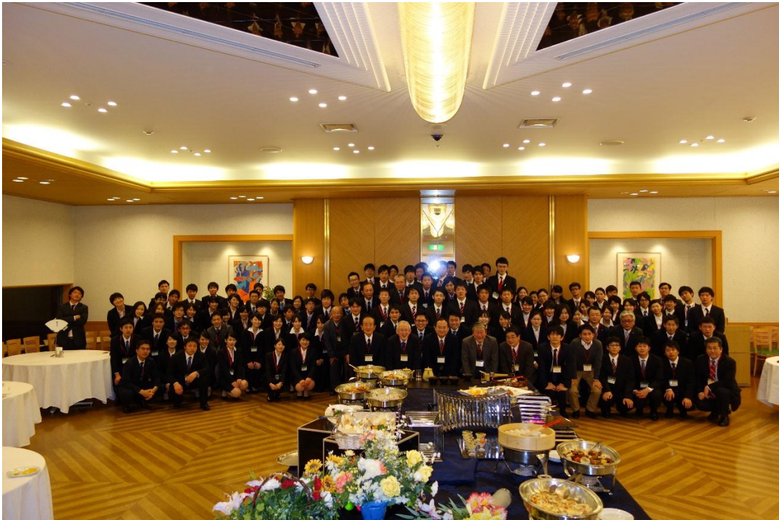
(先輩卒業生と学生の皆さん…今年も頑張るぞ!!)