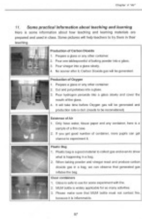
簡易実験操作作成手順