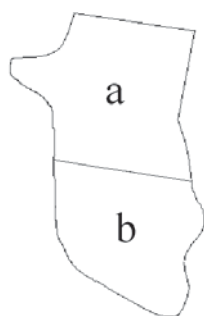
図 1. 試験に使用する 2 号圃場

ひと続きの圃場を、圃場 a と圃場 b の 2 つに分け(図 1)、除草剤を散布するタイミングをそれぞれ「播種後すぐ(発芽前)」と「発芽後 2~4 葉期」とする。