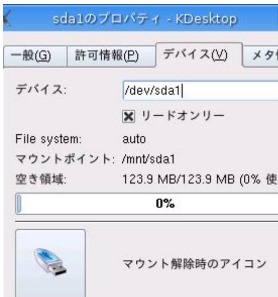
Fig. 2 プロパティのデバイスタブ

USB フラッシュメモリを挿すと、画面に Fig. 3 のようなアイコンが現れます。このアイコンの上へカーソルを持って行き、右クリックして、プロパティを選択します。プロパティのデバイスタブでリードオンリーの×を外します。この設定は未マウント時に行い、もし左クリックでマウントしてしまった場合は、一度アンマウントしてから行います。（アンマウント方法については後述を参照のこと）