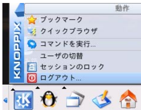
Fig. 6 ログアウトの選択

画面下部の一番左側の四角いアイコン（ペンギンの左隣）をクリックして、ログアウトを選択します。