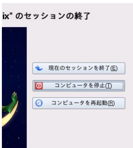
Fig. 7 セッションの終了

画面中央に出てきたセッション終了から「コンピュータを停止」を選択します。終了処理が進み、CD ドライブが自動的に開いた後、Enter キーを押すと電源が切れます。