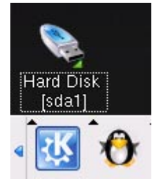
Fig. 4 マウント時

これで USB メモリに書き込む準備ができました。アイコン上にカーソルを置いてしばらく待つと以下のように表示され、「書き込み可」となっているのが分かります。