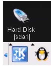
Fig. 3 未マウント時

この状態で USB メモリアイコンを右クリックして、マウントを選択します。USB メモリデバイスをマウントすると Fig. 4 のようにアイコンに小さな三角が付きます。