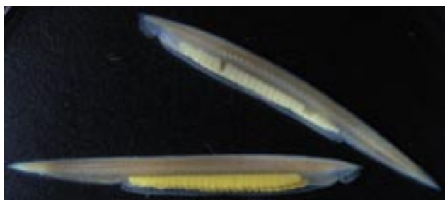
図1 ヒガシナメクジウオ成体 上: 生殖期の雄 下: 生殖期の雌

ナメクジウオ類(図1)は海産の動物であり、分類学的には脊索動物門の頭索動物亜門に分類される(図2)。脊索動物門は、我々ヒトを含む脊椎動物や、ホヤ類等からなる尾索動物、そして今回紹介する頭索動物より構成され、頭索動物は我々脊椎動物に最も解剖学的特徴が似ている動物である。そのため、我々ヒトを含めた脊椎動物の起源を考える上で重要な位置にある動物として注目されている 1) 。しかし一般にはなじみの薄い動物であり、その和名から誤解を招く事もある。