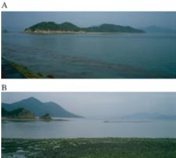
図3 A: 有竜島全景を北側から撮影したもの、B: 現在の有竜島西側に干潮時に現れる能地堆の一部

ヒガシナメクジウオと広島は、実に深い関わりを持っている。日本でナメクジウオ類が（学術的に）発見されたのは1881年広島県鞆での浮遊幼生の採集と、ドレッジ（海底の砂を集める道具）による成体の採集が初めてとされる。その後広島県三原沖の有竜島（有龍島、宇竜島、図3A）と呼ばれる無人の小島に続く砂洲から多数のナメクジウオが採集され、1928年にこの地域のナメクジウオが天然記念物に指定された。その地域は能地堆と呼ばれ、当時の干潮時には有竜島の西方から6 kmに渡って広大な砂洲が現れた（図3B）。