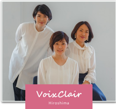
元 テレビ局のアナウンサー3名で結成