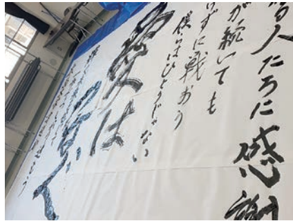
書道を通して日本文化に触れる