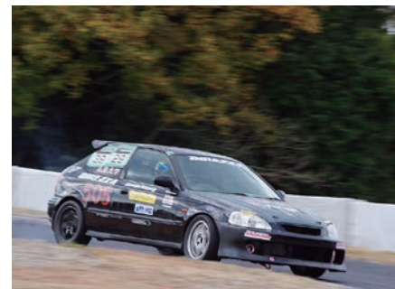
全日本学生ジムカーナ選手権大会 選手権大会 (体育会自動車部)