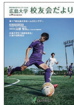
校友会だより第34号 (2023年9月発行)