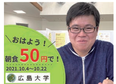
大学クラウドファンディングへの参加