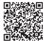
ドリーム チャレンジ賞

学術・文化・スポーツ等における学生の自主的な活動に活動資金を支援しています。これまで計17回実施した結果、598件の提案に対して総額9,220万円を助成しています。公募は年1回行われ、広島大学校友会正会員※3名以上を含む広島大学学生のグループによる取組みであることを応募資格としております。