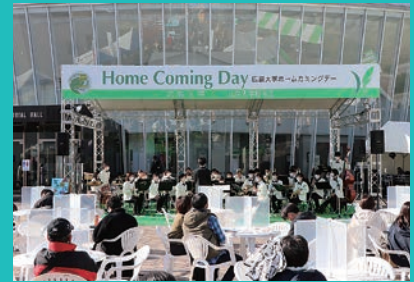
学生ステージ企画