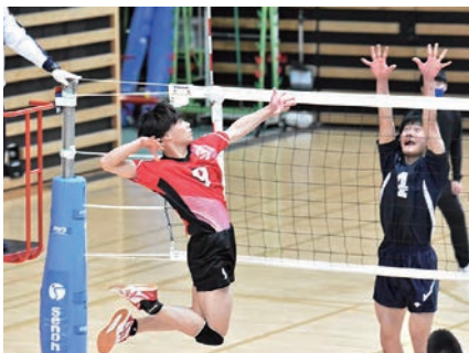
秩父宮賜杯前日本バレーボール 大学男子選手権大会 (体育会男子バレーボール部)