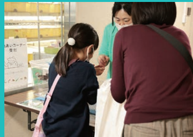
学部・研究科企画（理学部）