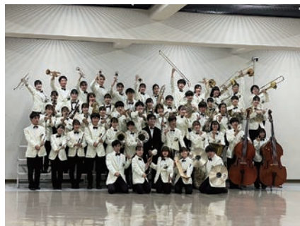
全日本吹奏楽コンクール (広島大学吹奏楽団)