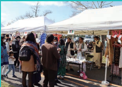
学部・研究科企画（国際協力研究科）