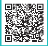
ホームカミングデー

広島大学ホームカミングデーは、広島大学と広島大学校友会が卒業生や元教職員などを招待して歓待するイベントです。毎年11月の第1土曜日に開催しており、メイン会場のサタケメモリアルホールで行われるオープニングセレモニーや著名人による講演会のほか、学部・研究科ごとの催しや連携する市町による物産展、学生によるステージ企画などを実施。多くの来場者を楽しんでいただいています。2021年度からはオンライン特設サイトも開設し、現地にお越しにならない方々へも本学の今の様子をお伝えしています。