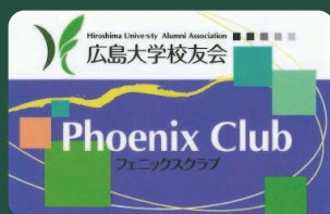
広島大学校友会会員証

「広島大学校友会」へ入会されますと、会員証に加え、入会記念グッズをプレゼントいたします！ 会員証を提示することにより、学内外の施設等で割引など各種サービスが受けられます。