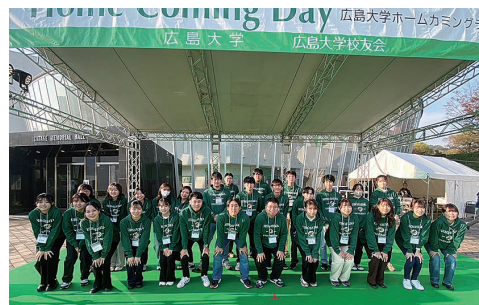
ホームカミングデーの学生スタッフ一同