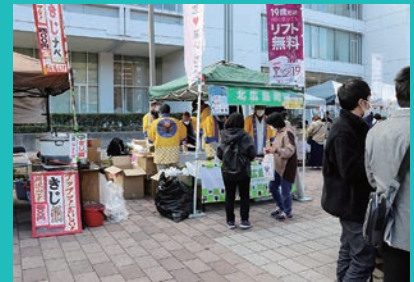
連携市町等の物産展