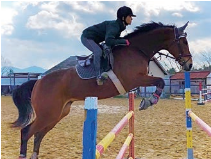
～広島大学馬術部の馬を 東京オリンピックへ出場させよう～