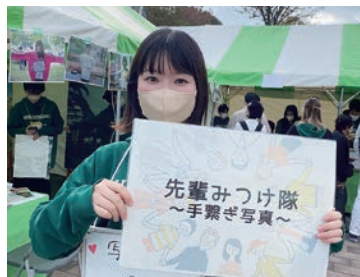
ホームカミングデーの企画・運営