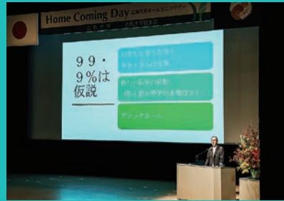
著名人による講演会