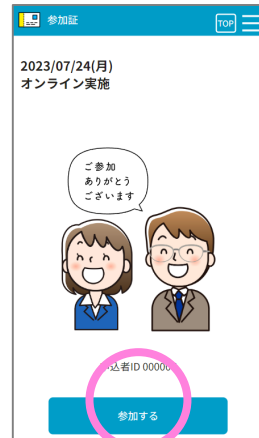
スワイプ後の画面