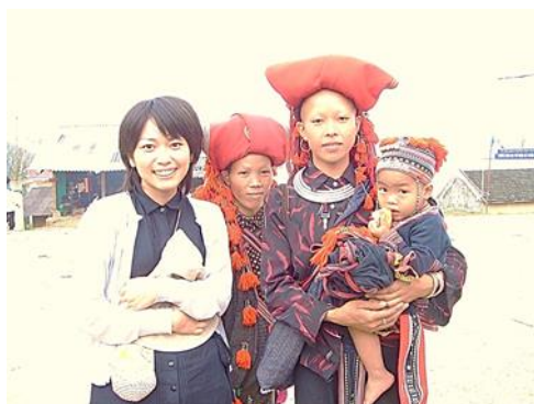
2006年 株式会社アルメック(ベトナム) インターンシップ時

「夢は必ず叶います、描くことができれば 20-30年後になりたい自分のプロフィールを書こう!」 「両立を超えて、やりたいことはすべてやる、できる」