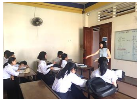
日本語の授業の様子 @メコン大学

G.ecboのインターンシップから現在までを振り返ってみれば、光陰矢の如し時間が過ぎていきました。なぜなら、大学院生活は、日々の授業、研究、論文執筆、就職活動と様々なことに追われていたからです。何事にも挑戦を続け、失敗や経験を積み重ねてきました。研究や論文執筆をサポートしてしまう日もありましたが、研究室の友人や先輩・後輩たちと励まし合い、諦めずに奮闘しました。指導教員と家族にも感謝をしています。