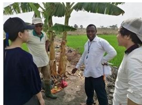
現地スタッフとの打ち合わせ

インターンシップを終え、体調を崩しかけながら修士論文を執筆、無事に大学院を卒業後、2年ぶり3回目の無職に返り咲きました。人生の打率の低さがここで響いてきたのかもしれませんが、7か月の浪人生活(無職)を経て現在の会社に当落線上ぎりぎりですぐに入社することができました。この業界は狭き門で、入ることができただけで幸運でした。また、それを超える幸運として28歳で国際開発コンサルタントになることができました。ただただ、私を受け入れてくださった会社に対して感謝の気持ちしかありません。