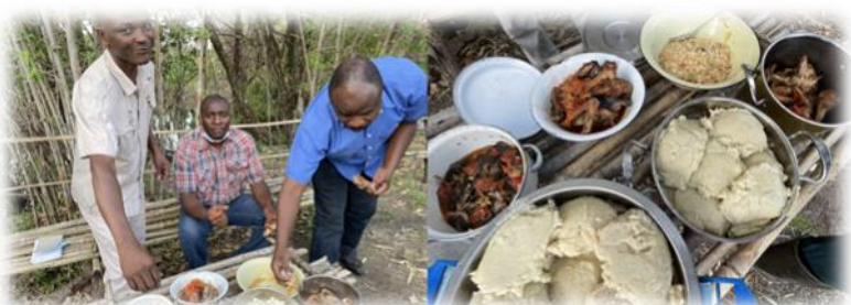
ザンビアの国民食シマを食べる人々