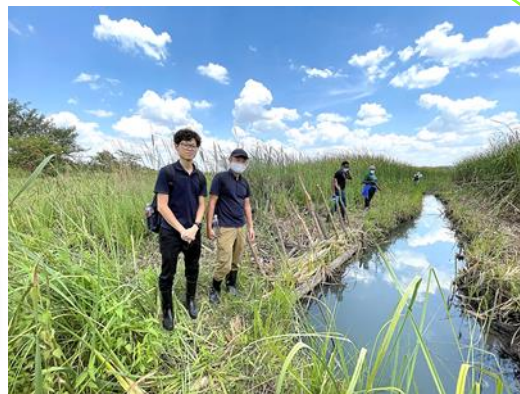
灌漑プロジェクトサイト