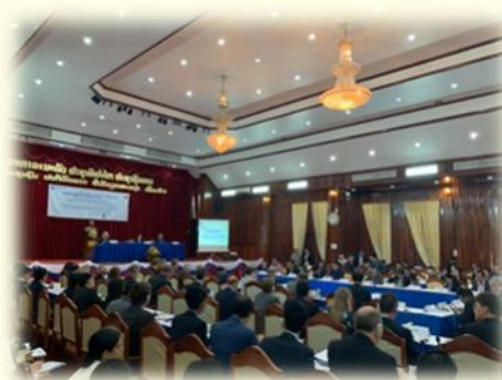
写真ラオスでのラウンドテーブル会合の様子 (2019年)

在ラオス日本大使館でもそうでしたが、JICAラオス事務所では日本の国際協力について、様々なスキームについて学び、またそれぞれのスキームの案件形成から実施中の調整、案件終了後の評価などの流れについて、実際に業務に携わる事ができました。特に、国際協力は相手国のニーズに対応できるよう、緊密に相手国政府と調整を行い、さらにその分野の他の開発パートナーとも調整し、援助効果を最大化することが求められていることが印象的でした。ラオスでは、政府が主体となり、ラウンドテーブルプロセスという援助協調の枠組みを設立し、その枠組みの中で様々な開発関係者が協調しながら支援を行おうとしていました。実際に、自分自身もその枠組みの中に身を置き、政府や他の機関とすり合わせを行いつつ、どのようにラオスの開発課題に取り組んでいくか検討するプロセスを経験できたことが、現在のUNDP(国連開発計画)での業務にも大きく役立っています。