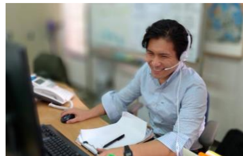
しっかり仕事をしている笑い男@Office

人生初の都会に住み、1500円のクラフトビールを買っても誰にも怒られず、家に高いビールがあると思うだけで頑張ることができています。現在は開発コンサルタントの末端としてCOVID-19に関わる案件で、医師の方々と、病院以外で初めてしっかりコミュニケーションをとっております。私は母が医療従事者なので、医療関係の案件に携わり、少しは親孝行できているのかなと思っています。その反面、COVID-19のせいで楽しいコートジボワールでのインターンを早めに終わらせられ、COVID-19のせいで全ての人生設計を狂わされた人々に代わり、本案件にしっかり取り組んでいます。