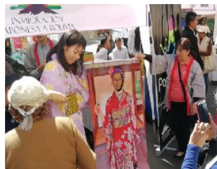
ポリビアでの国際交流イベントの様子 @Bolivian Park