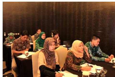
Internee from involved in a workshop