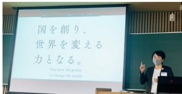
令和3年度 社会基盤環境工学 進路セミナーにて 日 時 : 2021年11月15日(月)13:15~17:50 場 所 : 広島大学工学部《進路セミナー》103講義室