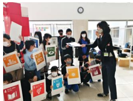
国際理解教育の一環で、中学生にSDGsについて説明の様子@JICA地球ひろば

インターンシップで担当した広報業務は、手掛ける業務範囲とても広く、正直、やりたいことは何でもできる！というポジションでした。逆に言うと、決められた業務がないため、自ら開拓していかないと何も始まらない状態でした。イベントのフライヤー作成から、所内へのアンケート作成などを行いました。まさに今、広報担当として同じ業務に従事しています。笑「広報がしたい！」という理由でインターンも現在の仕事も選んだわけではないのですが、色々な繋がりでここまでできました。0から1を生み出す業務は難しいですが、自分には合っていると感じます。