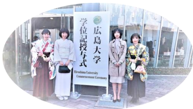
学位記授与式 @広島大学

学部卒業後、教員、JICA海外協力隊(青年海外協力隊)ガナでの2年間を経て、大学院、JICA職員とキャリアを積んでいます。必死に前を向いて藻掻いてきましたが、振り返ってみれば、軸は、教育×国際協力でした。途上国に興味を持ったきっかけは、義務教育のなかで、学校へ行くことが出来ない子どもたちがいると知ったことでした。これからも初心を忘れず教育分野での専門を生かし、国際協力に貢献していきたいです。