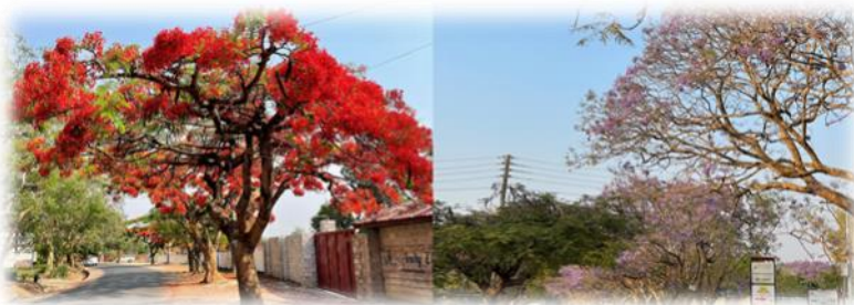
ザンビアの街中に咲く火炎樹の花/ジャカラランダの花