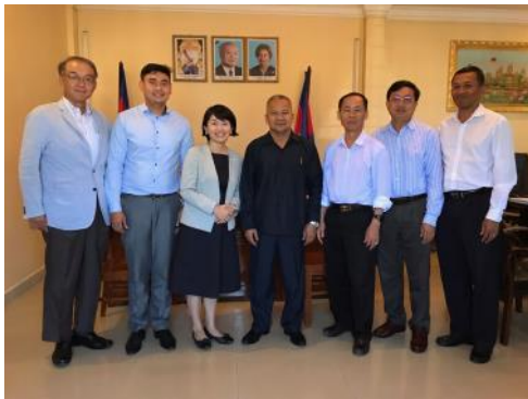
カンボジア赴任中、公共事業運輸省のメンバーと