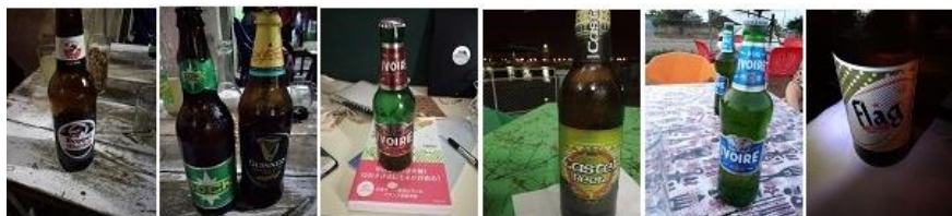
【異文化理解】住民との交流を兼ねてお店で注文できるすべてのビールを制覇@コートジボワールのBar

私も一般的な日本人であり、海外の方が海苔を消化できないように、ココナッツオイルが消化できないことを身をもって知りました。また、開発コンサルタントが現場で何をしているのか、現地プロジェクトメンバーとの関係性、プロジェクトの終わらせ方や、現地JICA事務所とのやりとりを実際に見ました。それらの経験が、面接の際に未経験ながらも仕事への理解度を高め、自信をもって面接に挑むことができました。