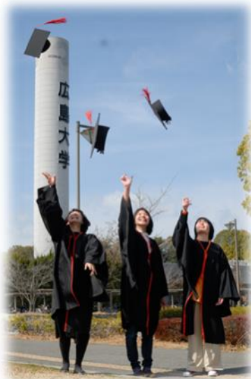
広島大学国際協力研究科 修了記念！