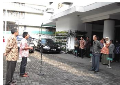
Internee conveyed a speech

please feel free to join West Java Environmental Agency.