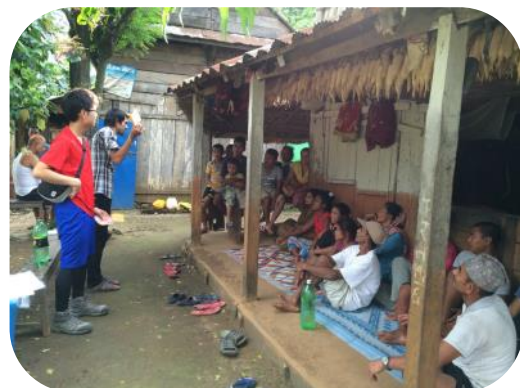
2015年 FORWARD Nepal (ネパール) インターンシップ時