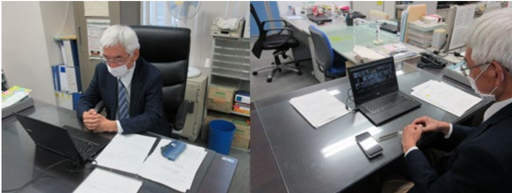
【吉村事務局長 挨拶】