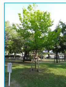
記念樹：プラタナスの木