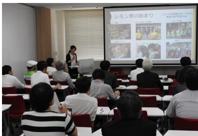
地域の方からのプレゼン