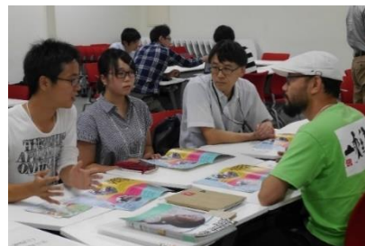
個別に交流・意見交換