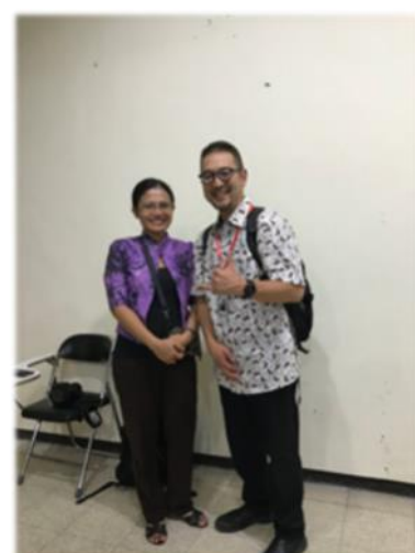
During my internship at Brawijaya