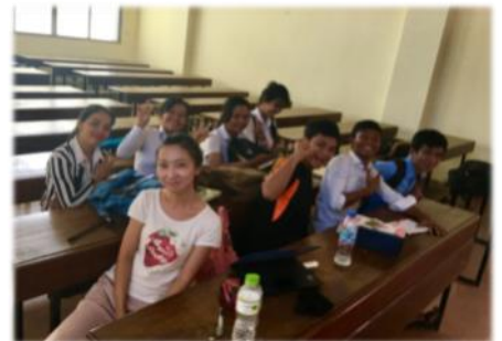
インターンシップ先の カンボジアメコン大学日本語ビジネス学科の学生と(2016年)

G.ecbo program is a valuable and meaningful program in Hiroshima University that provides students with overseas internship opportunities. I do believe what I have learned and gained from G.ecbo program will be beneficial to my further development.