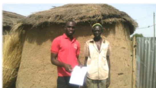
西マンブールジ地区での 現地調査(2016年)