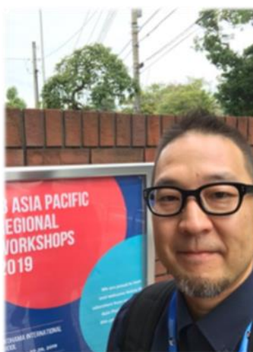
Regional international education training workshop