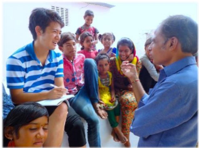
NGOの運営に関するインタビュー調査