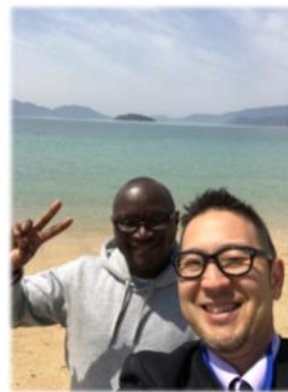
Fellow IDEC Graduate Student from Rwanda who cooperated with my school on an international exchange discussion and exchange

Terima Kasih Banyak, and a major thank you to my former advisor for her hard work and advice throughout the G.ecbo internship. It could not have been a success without her leadership and guidance. Also, I would like to owe a debt of gratitude to all the professors and staff at IDEC and who organize the G.ecbo program. Finally, thank you to the professors, staff, students at Brawijaya University, and also to the Senior student advisors in IDEC. Through this program, we made one part of the world closer and a little more peaceful. The only advice for those who will be graduating in the near future, comes from the words of the late Ralph Waldo Emerson, "Do not go where the path may lead, go instead where there is no path and lead a trail." As you begin your graduate school journey, or if you are near the end of it, don't be passive and don't take the safe road that everyone has already walked down. Be adventurous, take risks, fail, fail again, fail once more, then find success at the end of that failure. Create a new path towards success that others may follow in your footsteps, and someday they too may create their own path of success. どうもありがとうございました。