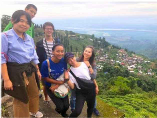
派遣先のスタディーツアー参加者と共に

子ども達と一緒に考える授業を作ることが出来る教師。子どもたちの個性を育てて上げることが出来る教師。そのために、常に様々なことにアンテナを張って、新しいことに挑戦し続けるようにしたいです。