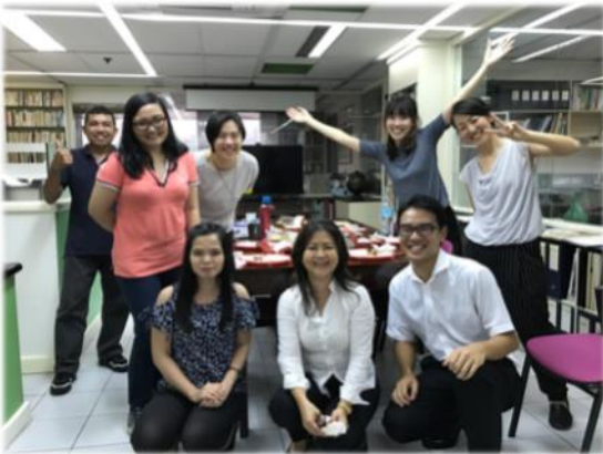
受け入れ先事務所で最終発表を終えた後の記念撮影

私の学部生時代の専門は土木工学で、大学院では交通工学研究室に所属していました。その当時から海外で仕事がしてみたいという漠然とした気持ちがありました。また、研究室が国際協力研究科という学生の約8割が留学生という環境で、その研究室にいて、留学生から「自分の街は交通渋滞がひどいから自分が解決するんだ」といった話をよく聞きました。日本で生まれ育ったので当たり前と思っていたことが海外では当たり前ではなく、自分の置かれている環境がいかに恵まれていたかを知らされました。このような経験から、私が当たり前だと思っていたものを途上国でも当たり前にしていきたいと思い、途上国の都市の交通問題の解決に貢献しようと考えようになりました。そこで、途上国における都市問題に対して計画から設計まで担っているオリエンタルコンサルタンツグローバルへの就職を決めました。