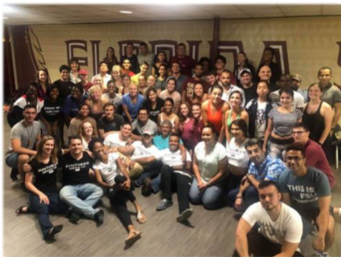
派遣先のフロリダ州立大学にて(2018年)