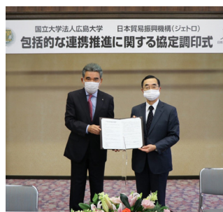
国立大学法人広島大学 日本貿易振興機構(ジェトロ) 包括的な連携推進に関する協定調印式

協定に当たり、ジェトロの佐々木伸彦理事長は「世界の様々な研究者や企業等が広島大学に来る仲立ちができるよう、両者の連携を深めたい」と挨拶した。連携内容は、大学の研究シーズと海外企業のニーズをマッチングする「グ