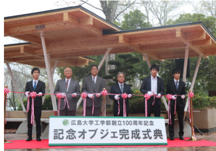
(工学部創立100周年記念オブジェテープカット)

なお、今回初めてオンラインホームカミングデーを同時開催し、遠方に住む方々にも参加いただいた。当日のプログラムや動画は、左記URLから視聴できる。(https://www.hiroshima-u.ac.jp/koyukai/home/online)