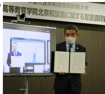
10月に大学間協定を締結し、本学最初の海外拠点である広島大学北京研究センターを首都師範大学内に設置して以来、緊密に連携して教育・研究交流を続けている。2015年には共同大学院プログラムを設置し、現在はダブルディグリープログラムの実施等を行っている。

森戸国際高等教育学院北京校は、広島大学の日本語・日本文化教育の中心を担っている森戸国際高等教育学院のフランチとして、2021年9月の教育開始を目指して、首都師範大学内に設置準備を進めている。設置後は、首都師範大学の学生をはじめとする、日本語・日本文化に興味のある中国の大学生に対して、実践的な日本語運用能力・日本文化理解力向上のための教育を行っていく予定。