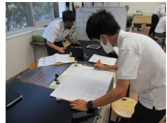
音声トラブルがありましたホワイトボードで迅速に対応！

今回は回線のトラブルでこちらの声が相手に聞こえないという事態になりましたが、オンラインのチャット機能で伝えたいことを入力したり、ホワイトボードやジェスチャーを駆使したりして、なんとか自分たちの研究を伝えることができました。お互い大変楽しくコミュニケーションができました。次回はさらにお互いの研究について語りしたいと思います。