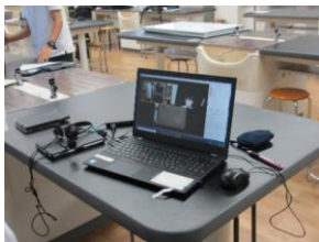
オンラインの様子