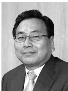
広島大学 理事(財務担当)